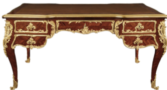
Bureau d'époque Louis XV

Inconnue au Moyen Age, la table fixe apparaît au cours du XVI ème siècle. Sous Louis XIII elle sera encore entièrement recouverte d'étoffe ; ce n'est que vers le milieu du XVII ème siècle avec le bureau Mazarin que l'on peut véritablement parler de « meubles à écrire ».